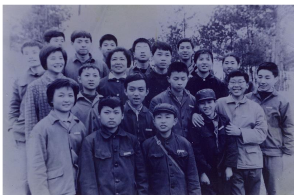
图2 1978年第一期少年班学生合影

到中国科大讲学,与少年大学生座谈,并为少年大学生题词:“青出于蓝,后继有人。”1983年1月27日,少年班创办五周年之际,李政道题词:“人才代出,创作当少年。桃李天下,教育数科大。”1984年5月2日,李政道再次来校讲学,与少年大学生座谈,并称赞:“这(少年班)不仅在中国教育史上是少见