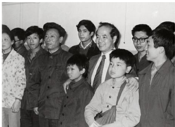
图3 1984年李政道先生访问中国科大,与少年班师生们合影留念

到中国科大讲学,与少年大学生座谈,并为少年大学生题词:“青出于蓝,后继有人。”1983年1月27日,少年班创办五周年之际,李政道题词:“人才代出,创作当少年。桃李天下,教育数科大。”1984年5月2日,李政道再次来校讲学,与少年大学生座谈,并称赞:“这(少年班)不仅在中国教育史上是少见