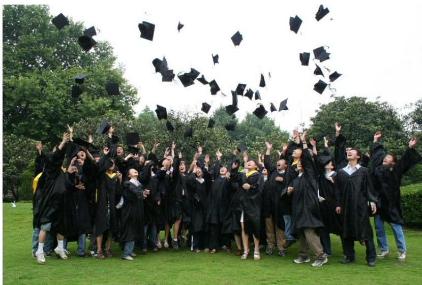
图5 少年班学院同学欢庆毕业